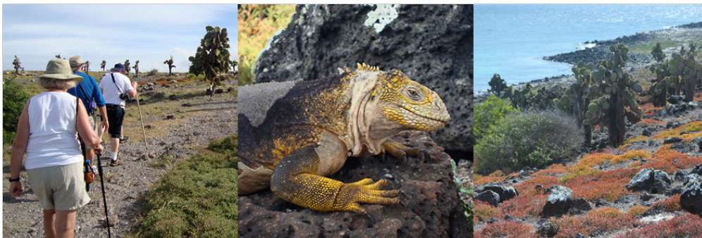
Insel Plaza Sur

Diese kleine Insel mit steilen Klippen wurde von aufsteigender Lava geformt und ist jetzt von Feigenkakteen bedeckt. Zudem beheimatet die Insel eine der größten Seelöwenkolonien sowie farbenfrohe rote und gelbe Landleguane. Die Pflanze, die für diese Insel am kennzeichnendsten ist, ist die Sesuvium. Während der Regenzeit strahlt sie in einem grünlichen bis gelblichen Ton, während sie in der Trockenzeit (Ende Juni bis Januar) in hellem Rot erleuchtet.