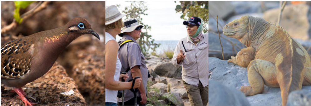
Insel Santa Fé, Insel Santa Fe

Am Morgen werden Sie auf der Insel Santa Fe (auch Barrington genannt) verbringen. Dor befindet sich eine kleine, malerische Bucht, welche ebenfalls Santa Fe heißt. An der Bucht gibt es zwei Wanderpfade für Besucher. Einer führt Sie zu einem fantastischen Aussichtspunkt auf einer Klippe, während sich der andere über einen kleinen Strand bis hin zu einem großen Feigenkakteen-Wald erstreckt.