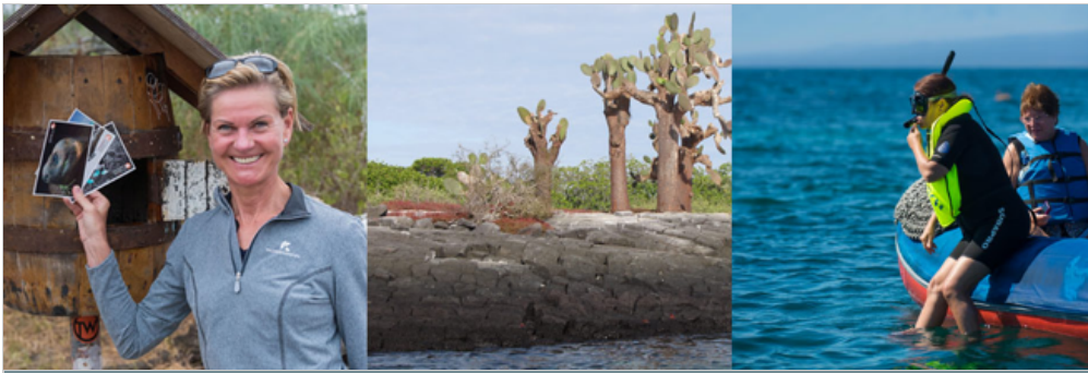
Post Office Bay, Insel Floreana