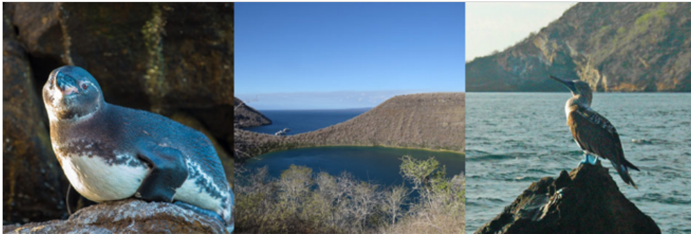
Tagus Cove, Insel Isabela

Morgens werden Sie die Tagus Cove auf der Insel Isabela besuchen, welche gegenüber der Insel Fernandina nahe dem die beiden Inseln teilenden Bolivar Kanal liegt. Dieser Ort wurde bereits 1800 von diversen Schiffen als Ankerplatz verwendet. Ein Pfad windet sich vorbei am Darwin-See und hoch zu einem Bergrücken während er Ihnen wunderbare Aussichten bietet. Punta Tortuga nördlich von der Tagus Bucht ist ein weiterer herrlicher Strand umgeben von Mangroven.