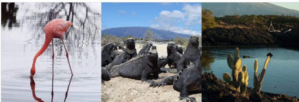
Punta Moreno, Insel Isabela

Nachmittags werden Sie den Punta Moreno im Südwesten von Elizabeth Bay besuchen. Hier angekommen erwartet Sie eine trockene Anlegestelle dort, wo einst flüssige Lava war. Die Lava hat durch ihren Strom Krater hinterlassen, welche sich zu kristallklaren Gezeiten-Pools entwickelt haben. Wenn Sie in diese Pools hineinschauen, können Sie in eine andere Welt eintauchen und das Unterwasserleben an sich vorbeiziehen lassen. In den halbsalzigen Pools dieser Gegend können Sie rosa Flamingos, Spießenten und gemeine Teichrallen sehen. Wenn Sie vorsichtig in die Pools schauen, können Sie möglicherweise Weißspitzenriffhaie oder Meeresschildkröten sehen.