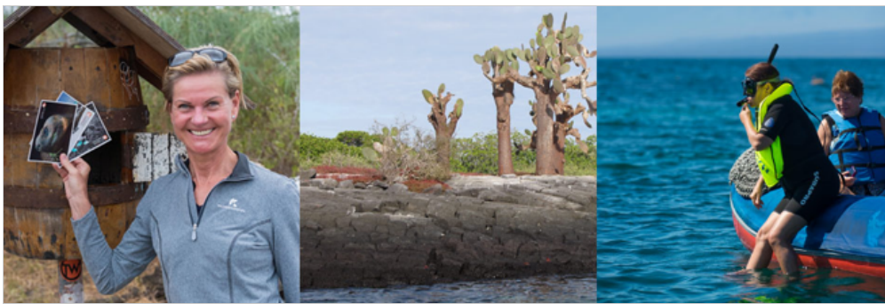
Post Office Bay, Insel Floreana