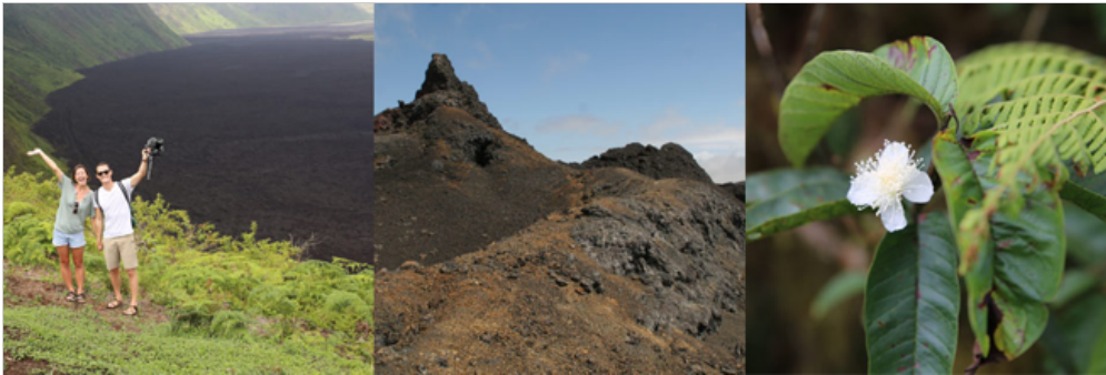
Sierra Negra Vulkan, Insel Isabela

Morgens werden Sie den Sierra Negra Vulkan besuchen, welcher mit einem Durchmesser von 10km den größten basaltische Krater im Galapagos-Archipel darstellt. Der Besuch wird Ihnen eindrucksvolle Ausblicke sowie die Möglichkeit, bis zu sieben Finken-Spezies und eine wunderschöne Vegetation zu beobachten. Die Nordseite des Kraters bietet noch immer Hinweise auf die jüngste vulkanische Aktivität im Jahr 2005.