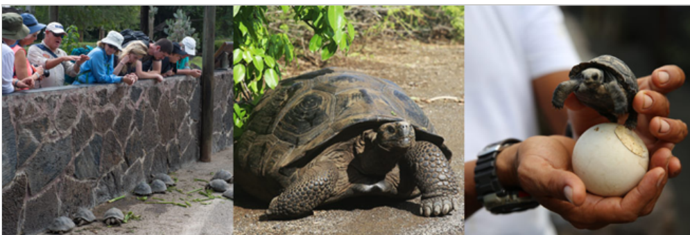
Arnaldo Tupiza Zuchtstation, Insel Isabela

Nachmittag werden Sie die Arnaldo Tupiza Zuchtstation auf der Insel Isabela besuchen. Sie liegt ca. 1,5 km von Puerto Villamil entfernt. In dieser Zuchtstation wurden Schildkrötenpopulationen vom Sierra Negra Vulkan, Cerro Azul, Cazuela, Cinco Cerros, Roca Union, San Pedro, Tables und Cerro Paloma in Gefangenschaft gezüchtet. Insgesamt leben hier 330 junge und ausgewachsene Schildkröten.