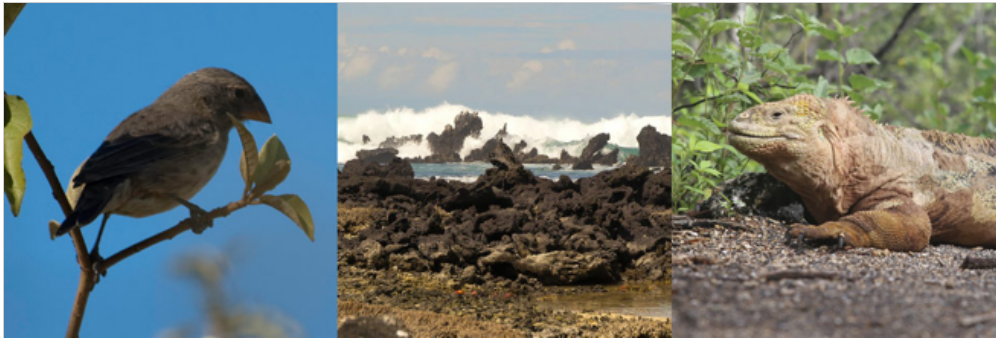
Bahía Urbina, Insel Isabela

Morgens werden Sie Bahía Urbina am Fuße des Alcedo Vulkans an der Westküste zwischen Tagus Bay und Elizabeth Bay besuchen. Diese Gegend hat 1954 eine erhebliche Anhebung der Erde erfahren, wodurch das Land um nahezu 5 Meter angehoben wurde. Die Küste hat sich dadurch um einen knappen Kilometer erweitert und Meeresbewohner sind an der neuen Küste gestrandet. Das Gebiet eignet sich gut zum Schnorcheln.