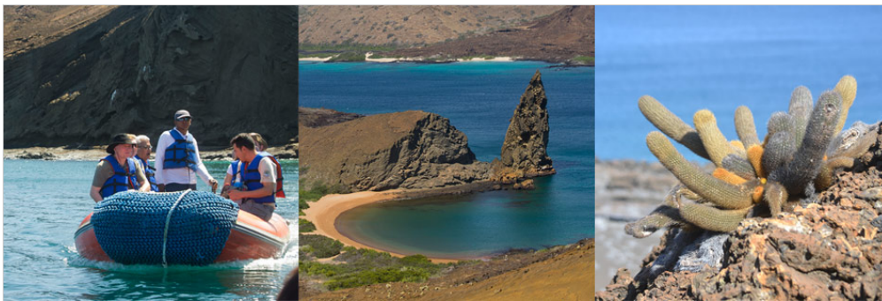
Roca del Pináculo, Isla Bartholomew

La isla Bartholomew es hogar de una de las vistas más icónicas en Galápagos: la Roca del Pináculo. Tomaremos un sendero de escaleras hacia la cima del volcán central de la isla (aproximadamente unos 30 o 40 minutos) donde podrá disfrutar una de las más maravillosas vistas. Una pequeña y hermosa playa de arena blanca rodeada por vegetación es perfecta para ver nadar a los pingüinos de Galápagos.