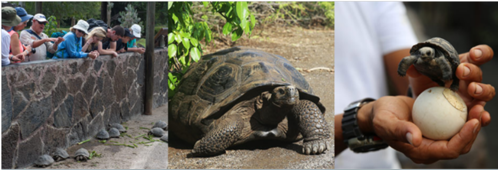
Centro de Crianza Arnaldo Tupiza, Isla Isabela

Visitará el Centro de Crianza Arnaldo Tupiza de Isabela, el cuál se encuentra a una milla (1,5 km) de Puerto Villamil. En este centro, poblaciones de tortugas de los volcanes Sierra Negra, Cerro Azul, Cazuela, Cinco Cerros, Roca Unión, San Pedro, Mesas y Cerro Paloma han sido criados en cautiverio. En total hay 330 tortugas juveniles y adultas.