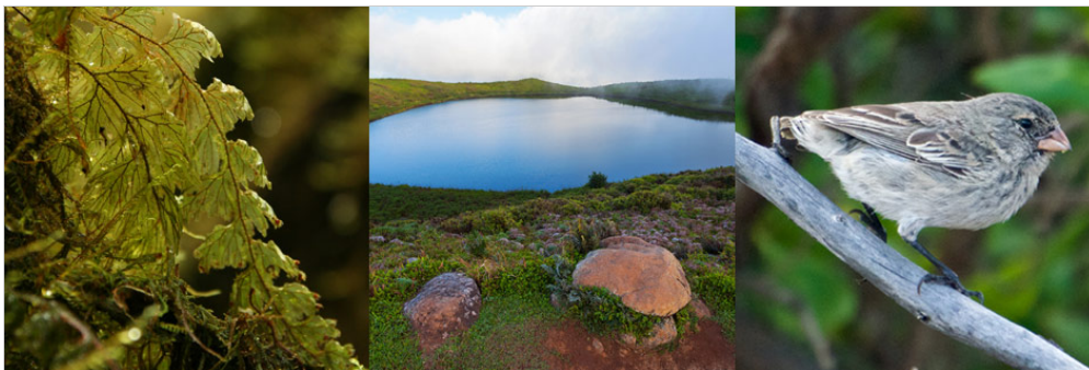
Laguna El Junco, Isla San Cristobal

Ubicado en las tierras altas a 19 kilómetros de Puerto Baquerizo Moreno, El Junco se encuentra en la caldera de un volcán extinto. El agua de lluvia alimenta la laguna. Hay muchas granjas y ranchos en esta área de la isla de San Cristóbal, y podría encontrar ganado cerca de la laguna.