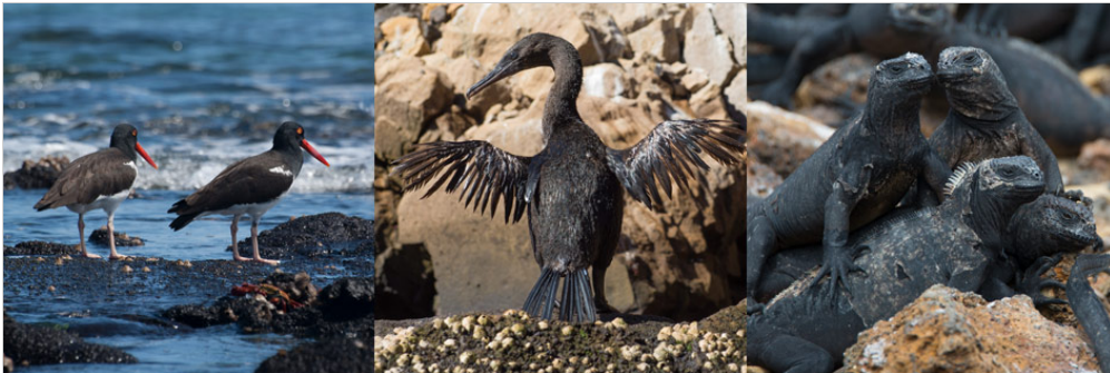
Punta Espinoza, Insel Fernandina

Morgens werden Sie zunächst den Bolivar Kanal durchfahren, welcher die Inseln Isabela und Fernandina trennt. Anschließend werden wir am Punta Espinoza anlegen. Dort werden Sie an einer Kolonie Meeresleguane und einer Gruppe Seelöwen vorbeilaufen, bevor Sie das Highlight der Insel entdecken: Der Nistplatz der flugunfähigen Kormorane. Dieses Gebiet bietet Ihnen zudem eine großartige Gelegenheit, den Galapagos-Falken zu sehen.