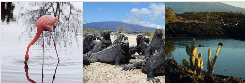
Punta Moreno, Insel Isabela

Morgens werden Sie den Punta Moreno im Südwesten von Elizabeth Bay besuchen. Hier angekommen erwartet Sie eine trockene Anlegestelle dort, wo einst flüssige Lava war. Die Lava hat durch ihren Strom Krater hinterlassen, welche sich zu kristallklaren Gezeiten-Pools entwickelt haben. Wenn Sie in diese Pools hineinsehen, können Sie in eine andere Welt eintauchen und das Unterwasserleben an sich vorbeiziehen lassen. In den halbsalzigen Pools dieser Gegend können Sie rosa Flamingos, Spießenten und gemeine Teichrallen sehen. Wenn Sie vorsichtig in die Pools schauen, können Sie möglicherweise Weißspitzenriffhaie oder Meeresschildkröten sehen.