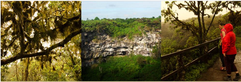
Twin Krater, Insel Santa Cruz