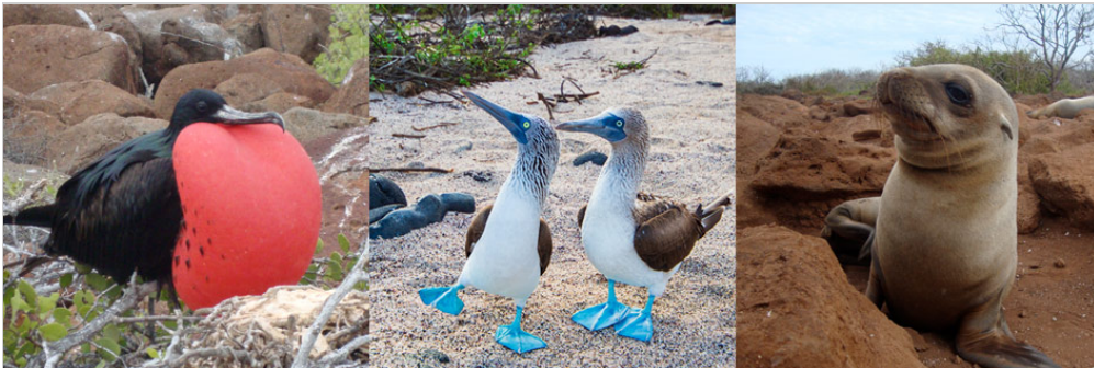
Insel Seymour Nord

In Seymour Nord werden Sie Galapagos Seelöwen, Blaufußtölpel und prachtvolle Fregattvögel sehen, welche auf dieser Insel sehr zahlreich sind. Nord Seymour wurde von einer Reihe an Unterwasser-Lawaströmen geformt. Sie besteht aus verschiedenen Sedimentschichten, welche durch tektonische Aktivität angehoben wurden. Die Insel zeichnet sich durch ihre trockene Vegetation aus.