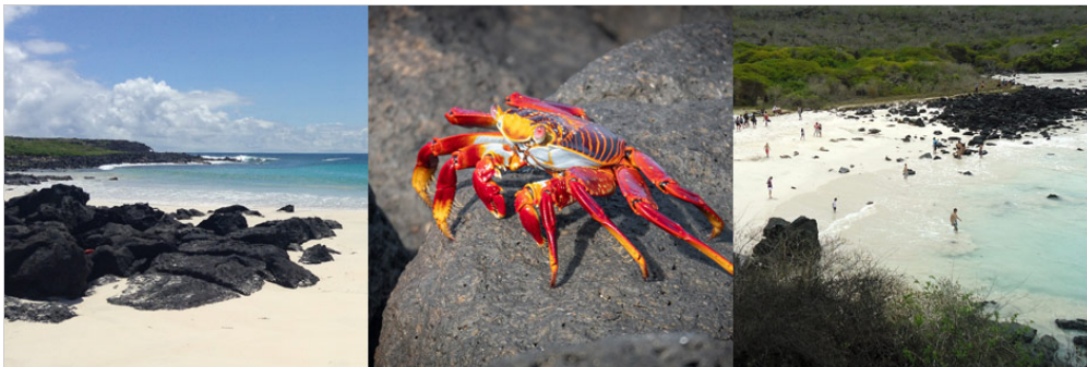
Puerto Chino, Insel San Cristobal

Am Nachmittag werden Sie Puerto Chino, den „chinesischen Hafen“, besuchen. Dieser liegt 24,5km vom Puerto Baquerizo Moreno und wenige Kilometer von der Zuchtstation Cerro Colorado entfernt. Innerhalb von ca. 30 Minuten können sie fußläufig den Strand erreichen.