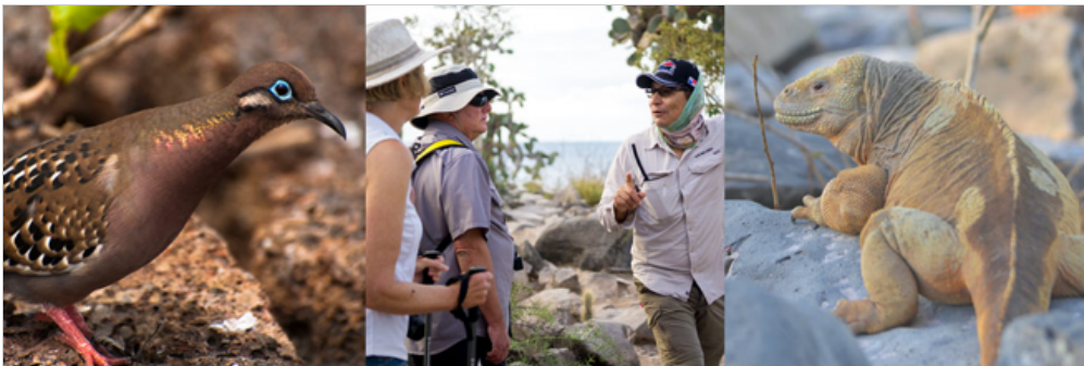
Insel Santa Fé, Insel Santa Fe

Am Morgen werden Sie auf der Insel Santa Fe (auch Barrington genannt) verbringen. Dor befindet sich eine kleine, malerische Bucht, welche ebenfalls Santa Fe heißt. An der Bucht gibt es zwei Wanderpfade für Besucher. Einer führt Sie zu einem fantastischen Aussichtspunkt auf einer Klippe, während sich der andere über einen kleinen Strand bis hin zu einem großen Feigenkakteen-Wald erstreckt.