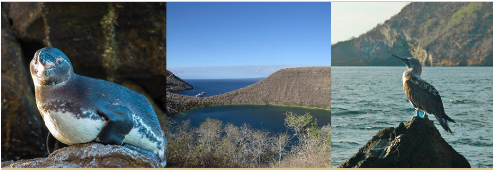
Tagus Cove, Insel Isabela