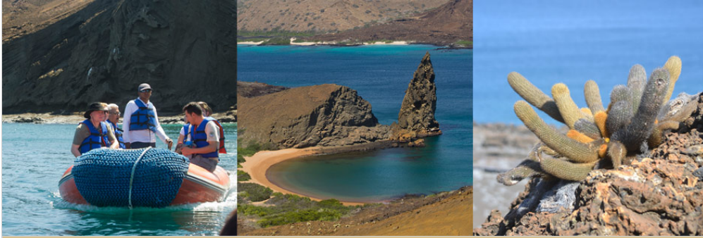
Pinnacle Rock, Insel Bartholomew