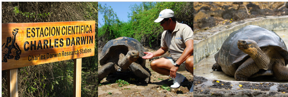
Centro de Crianza Fausto Llerena, Isla Santa Cruz

Visitaremos el centro de crianza Fausto Llerena en Puerto Ayora, Isla Santa Cruz, donde se crían tortugas gigantes en cautiverio. Este es el hogar de tortugas que van desde 3 pulgadas (crías) a 4 pies de largo cuando son adultas. Las crías permanecen hasta que tienen aproximadamente cuatro años y son lo suficientemente fuertes como para sobrevivir por sí solas. Las subespecies de las tortugas gigantes interactúan entre sí, y muchas de las más viejas extienden sus cabezas en presencia de humanos para brindarles la oportunidad de una foto.